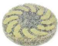
Spiral per ripristino e lucidatura di cemento, marmo, terrazzo e pietre naturali.