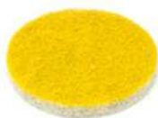
Hyper Shine Soft per pulire e lucidare.