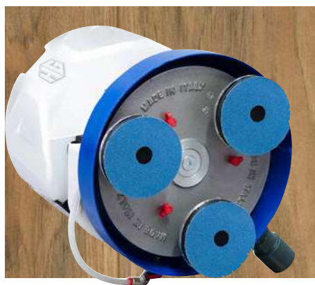
Levigatura e Lucidatura PARQUET