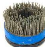
Antique Brush per anticare marmo, pietra, cotto e parquet.