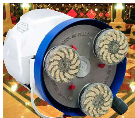
Pads diamantati per RIPRISTINO