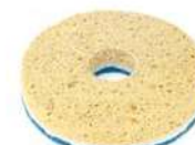
Spongelux per un'azione pulente e lucidante con un solo passaggio.