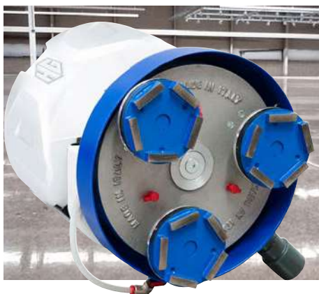
Levigatura e Lucidatura CEMENTO