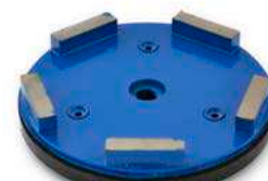
Utensili metallici per Cemento gamma completa per ogni tipo di cemento.