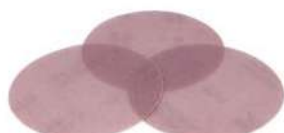
Carta Retinata per risultati di levigatura precisi e uniformi.