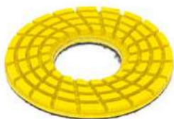
Giaguar Flex Yellow per lucidare marmo.