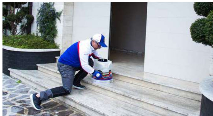
LEVIGATURA E LUCIDATURA SCALE