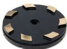
Utensili metallici per Marmo