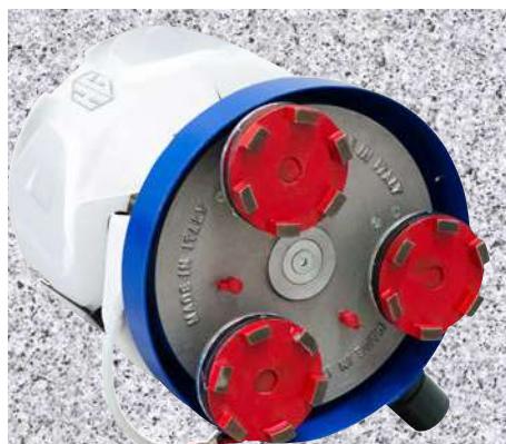
Levigatura e Lucidatura GRANITO