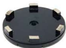
Utensili metallici per Granito