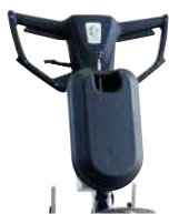
Manico corto con serbatoio 8lt per lavorare in piedi sulle scale.