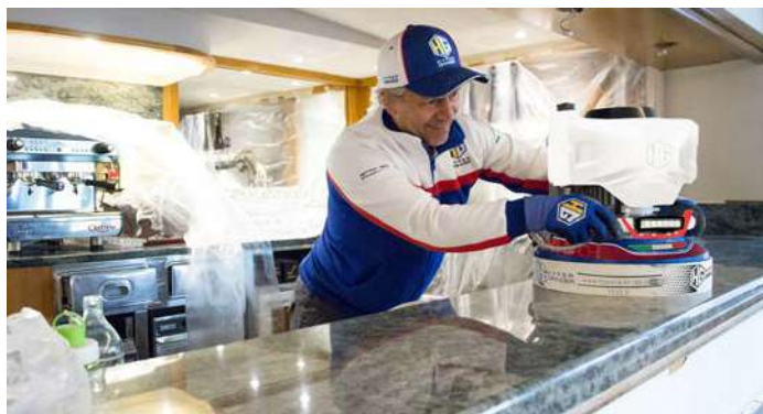
LEVIGATURA E LUCIDATURA BANCONI E TOP

Hyper Counter Top è un Planetario manuale ideale per levigare e lucidare banconi, scale, top e piccole superfici. Grazie al potente motore e al robusto planetario contro-rotante è possibile lavorare su marmi, graniti e cemento. Si differenzia nel mercato delle levigatrici manuali per la sua robustezza e il perfetto bilanciamento. La velocità degli abrasivi e il movimento contro-rotante è stato studiato per rendere la macchina stabile, rendendo le lavorazioni semplici e non faticose. Hyper Counter Top è fornita di paraschizzi e convogliatore della polvere. Sono disponibili anche le spazzole per effetti anticati. Inoltre con il kit accessorio manico lungo è possibile trasformare la Hyper Counter Top in una macchina completa anche per: • Levigare e lucidare scale, pianerottoli. • Levigare e lucidare pavimenti in marmo, in pietra, in cemento. • Carteggiare e levigare il parquet. • Spazzolare ed anticare marmi, pietre, legno.