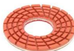
Giaguar Flex Green per lucidare granito.