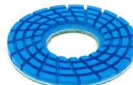
Giaguar Flex Universal per applicazioni universali.