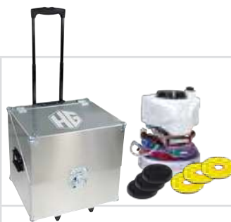
Trolley in acciaio