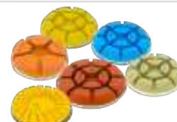
Resinoidi X-Line gamma completa per ogni tipo di superficie.