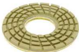
Giaguar Flex Green per lucidare cemento.