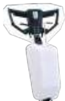
Manico lungo con serbatoio 12 litri per levigare pavimenti.