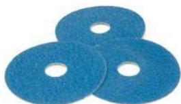
Carta Vetrata di elevata flessibilità per lavorazioni su legno.