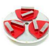
Trascinatore Ready Cool e utensili Quick lock