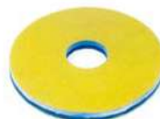
Hyper Shine Plus per ripristinare il lucido.