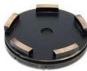
SERIE MTM per levigare terrazzo, agglomerato, limestone, travertino e pavimenti abrasivi.