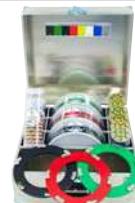
TOOLS BOX Kit per levigatura e lucidatura con trolley in acciaio.