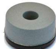
PAVELUX per rimuovere mastice o levigare marmo e granito.