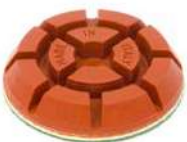
JUMPY RED dischi diamantati resinoidi per lucidare granito e gres.