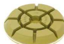
JUMPY GREEN per levigare e lucidare pavimenti in cemento.