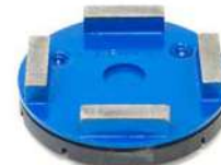
HG-A utensili diamantati per cementi molto abrasivi e asfalto.