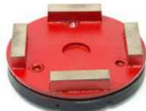
HG-S utensili diamantati per cemento morbido.