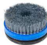
ANTIQUE BRUSH sistema per anticare marmo, pietra e cotto.