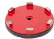
SERIE GM Dischi diamantati metallici per levigare granito e gres.