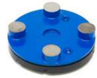
BT ROUND per rimozione di resine e vernici a basso spessore.