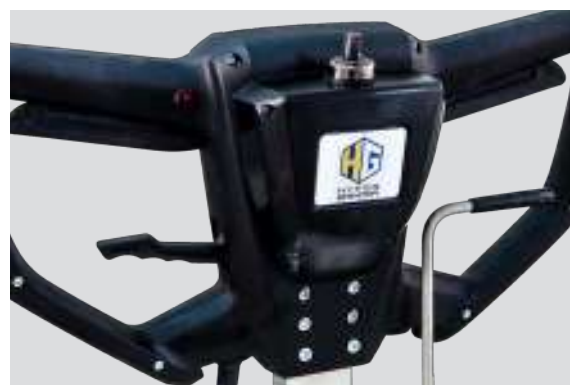
Variatore di velocità per massimizzare le performance in ogni situazione.