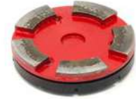
HG-M utensili diamantati per cementi medio abrasivi.