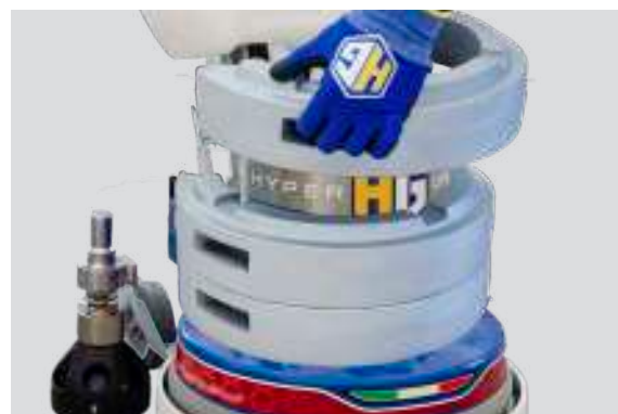
Pesi dedicati in ghisa, per levigare e lucidare anche le pietre più dure. (17 Kg cad.)