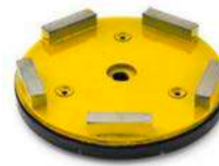
TCK SERIES preparazione e rimozione di rivestimenti su pavimenti in cemento.