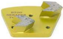
TCK ARROW per rimozione di resine e vernici su pavimenti in cemento duro.