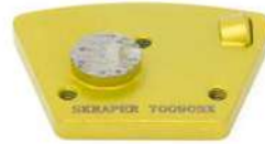
PDC SCRAPER per rimozione resine e rivestimenti a spessore.