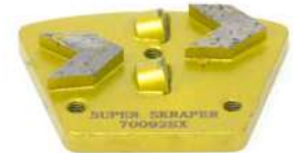
PDC HYPER SCRAPER per rimozione resine e rivestimenti a spessore.