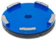
HG-H utensili diamantati per la molatura di pavimenti DURI.