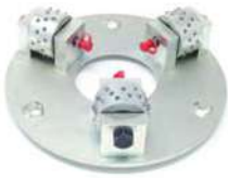
BUSH HAMMER utensile esclusivo utile per molte applicazioni.