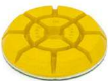
JUMPY YELLOW dischi resinoidi per lucidare pavimenti in marmo.