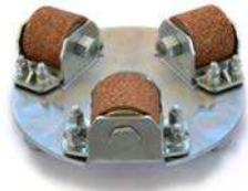
SANDBLASTING per effetto sabbatura.