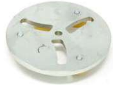
READY COOL piatto per utensili trapezoidi Quick lock.