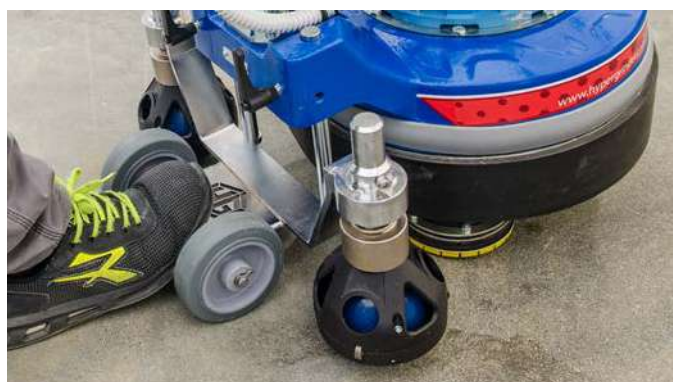
Nuove ruote di lavoro a sfera ammortizzate. Sollevabili e regolabili in altezza.