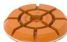
JUMPY ORANGE per lucidare Graniglia, Terrazzo, Limestone e Seminati.