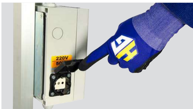
Presca 220V supplementare a bordo posta sul retro dell'asta manico.