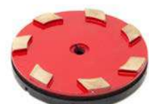
SERIE MM dischi diamantati metallici per la levigatura del marmo.