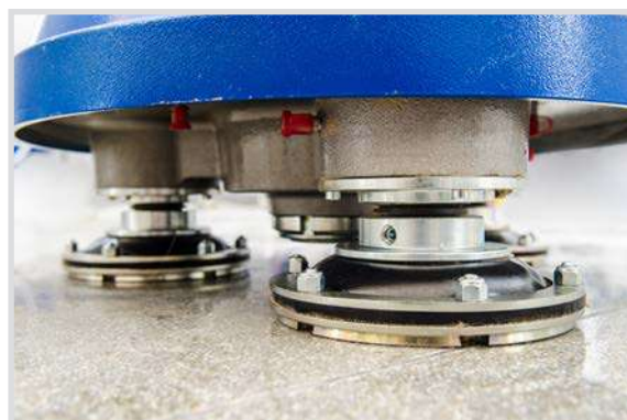
I satelliti porta utensili con nuovi giunti flessibili anti-shock aumentano stabilità e maneggevolezza.