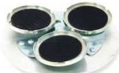
SPRING HOLD SYSTEM per una lucidatura del cemento perfetta e omogenea.